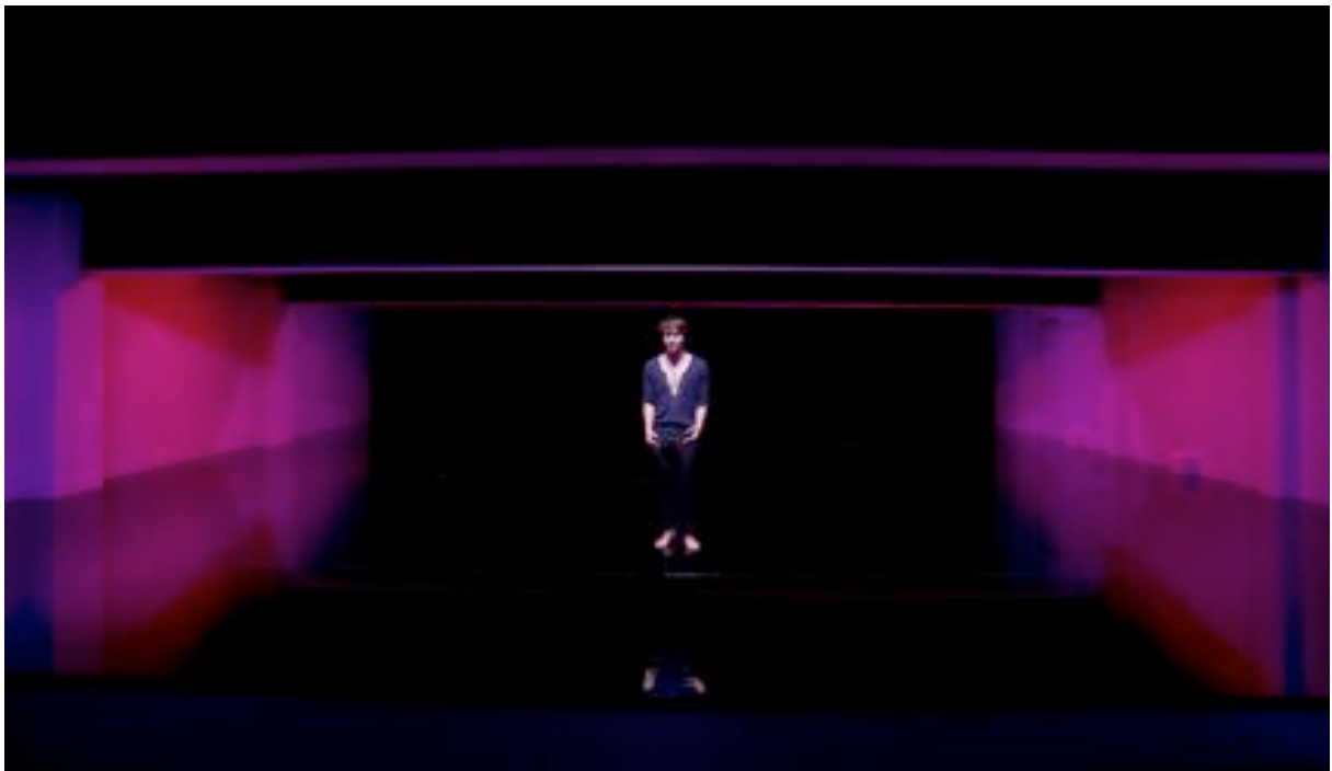
Brume de Dieu